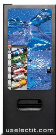
CB 300 satellite 46 200,00 грн